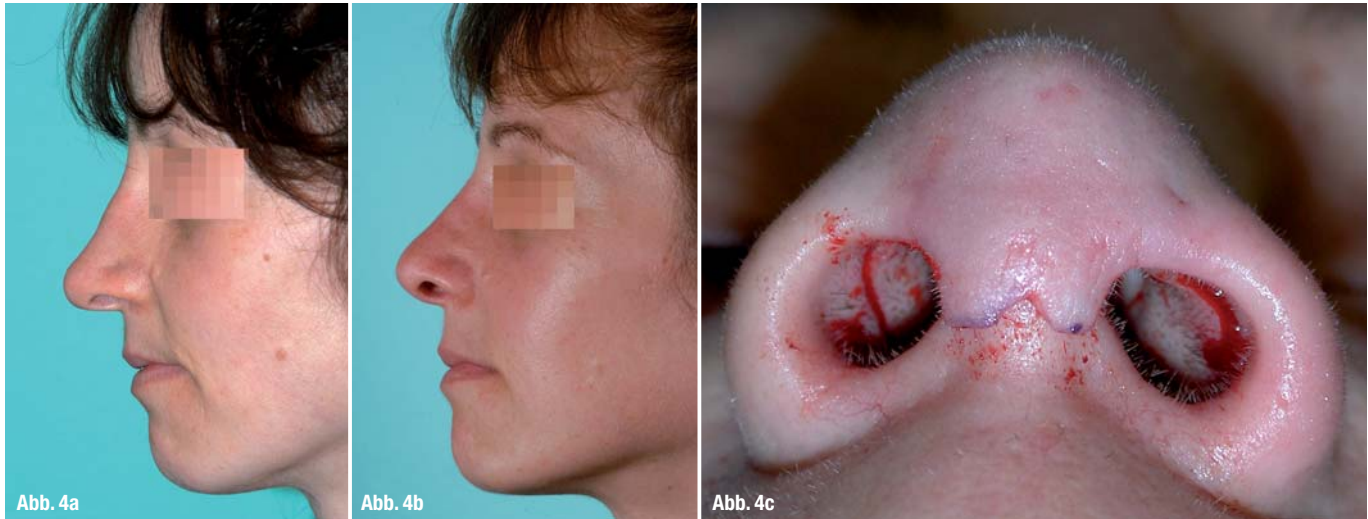
Abb. 4a _ Nach drei Voroperationen auswärts ist die Nasenspitze noch immer überprojiziert.