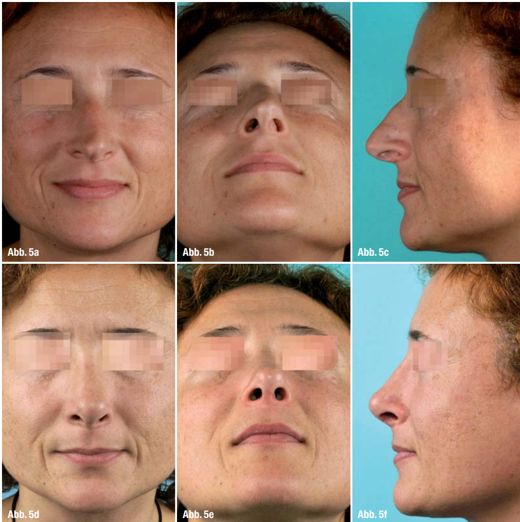
Abb. 5a–c _ Rhinomegalie Höcker-Schiefnase, Asymmetrie der überprojizierten Nasenspitze, Septumdeviation mit Subluxation der Septumvorderkante.